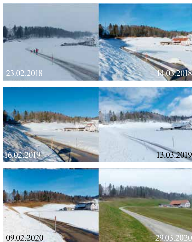
Les Bugnenets-Savagnières.

Une collection de prises de vues permet de comparer l'évolution de l'enneigement sur plusieurs années. Les fluctuations météorologiques importantes constatées sur le site rendent les résultats difficiles à interpréter rapidement. Le suivi photographique gagnera en signification avec le temps et ne pourra être interprété qu'à la lumière des facteurs d'évolution liés aux changements climatiques.