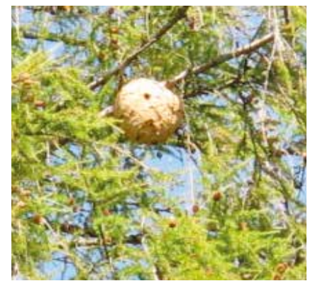
Un gros ballon dans un mélèze à Fontainemelon: c'est un nid de frelons asiatiques.

Le frelon asiatique se plaît de plus en plus dans notre région. Construit dans un mélèze à 27 mètres de haut, un nid d'un diamètre de 50 centimètres a été découvert cet automne à Fontainemelon. C'est ce qu'a indiqué Evologia dans son infolettre. Ce gros ballon avait dans ses rayons de papier quelques centaines de reines prêtes à hiberner et à reformer de nouvelles colonies au printemps prochain. Il a été détruit par des spécialistes. Gros prédateur d'insectes, le frelon asiatique dispose avec les ruchers de restaurants cinq étoiles. /comm