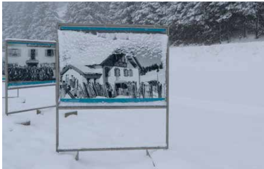
Une expo photos à découvrir entre la Vue-des-Alpes et Tête-de-Ran. (Photo pif).

Pro Senectute Arc jurassien propose pour les aînés et les aînées des cours de yoga tous les mardis de 9h45 à 10h45 aux Hauts-Geneveys. Responsable: Mélanie Harris. Informations et inscriptions: 032 886 83 02.