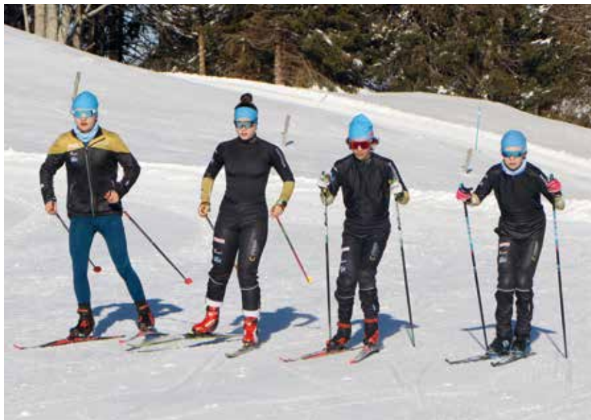
A La Vue, les jeunes fondeurs trouvent souvent d'excellentes conditions. (Photo pif).

cembre. Il y avait foule et les parkings du Pré Raguel étaient plus que complets: «C'est pire qu'à la Fête des vendanges», a lancé un promeneur de passage. L'hiver a commencé fort avec un premier traçage de piste le 26 novembre. Et quand il n'y a pas de neige ailleurs, on vient à «La Vue». C'est aussi vrai pour les jeunes du CRP dont le site constitue un point d'ancrage. Il profite de la qualité du traçage assuré quotidiennement par Jérémy Huguenin, engagé à plein temps durant l'intégralité de l'hiver. Et ils peuvent aussi se tester, tant techniquement que physiquement, sur une boucle de cinq kilomètres conçue en priorité pour les compétiteurs. Elle est surnommée l'Infernale et elle est terrible. /pif