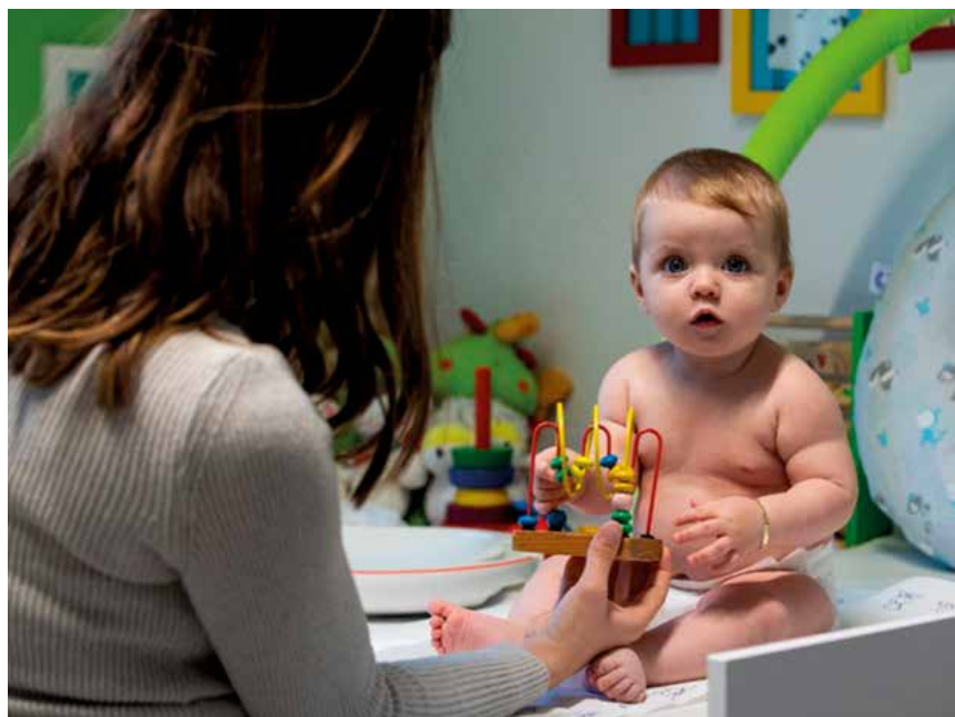
Un service pour répondre aux premiers soins des enfants.

Alimentation, allaitement, sommeil: ce sont autant de points essentiels qui peuvent influencer sur la santé d'un nouveau-né sur le long terme. Ce sont aussi autant de questionnements de la part des parents. Leurs inquiétudes sont légitimes: devenir parents est un «métier» qui s'apprend sur le tas au fil de ses expériences: « Mais les parents ont des ressources qu'ils ont tendance à igno-