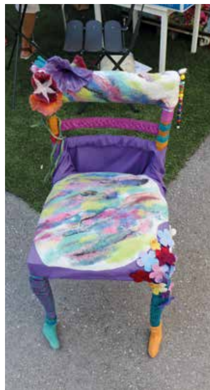
La chaise de Laines d'ici ne sera pas laissée vide: l'association est sauvée. (Photo pif).

Le Parc Chasseral rappelle qu'à Cernier, il collabore étroitement avec Evologia,